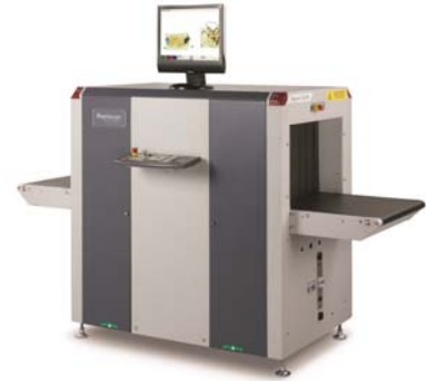
Kích thước khoang soi (Rộng x Cao): 620x420 mm.