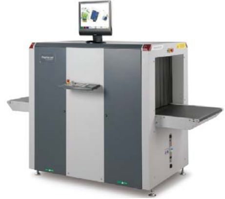
Kích thước khoang soi (Rộng x Cao): 750x550mm.

Rapiscan 622XR có hiệu suất chất lượng hình ảnh phù hợp với quy định (EC) số 300/2008. Ngoài ra, chức năng chèn hình ảnh nguy hiểm (TIP) là phù hợp với quy định (EU) số 185/2010.